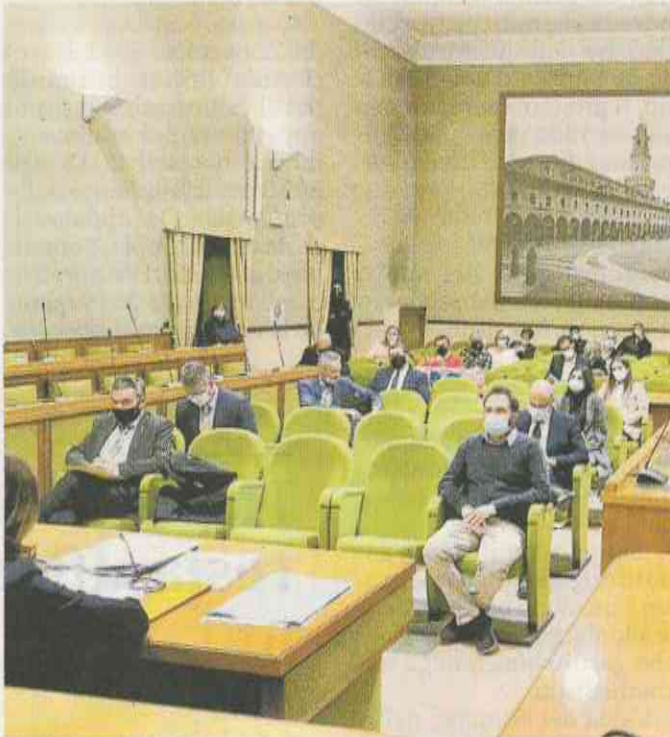
Pubblici redditi e i patrimoni dichiarati da giunta e consiglieri