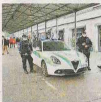
Controlli in centro storico