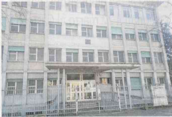
La sede Asst di viale Montegrappa. La ristrutturazione sarebbe dovuta durare due anni ma si è reso necessario un altro progetto